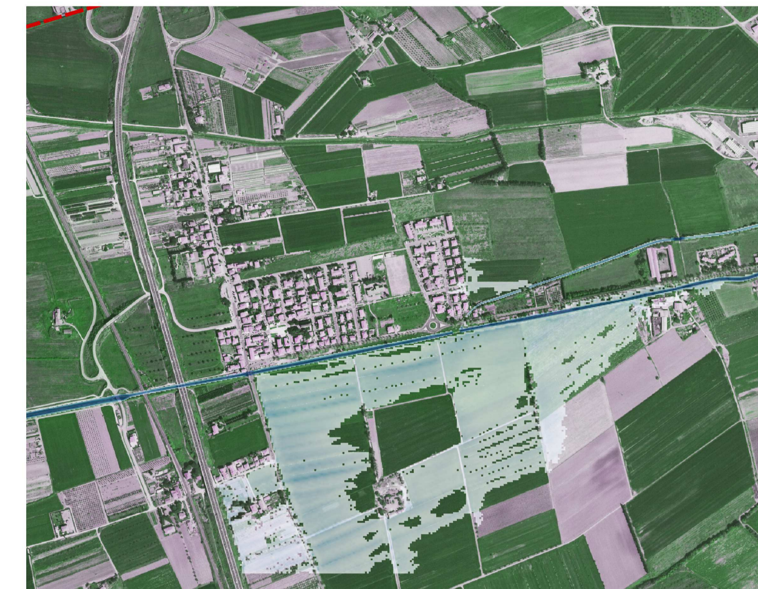
ESONDAZIONI TR30- FOSSO DELLE TANE