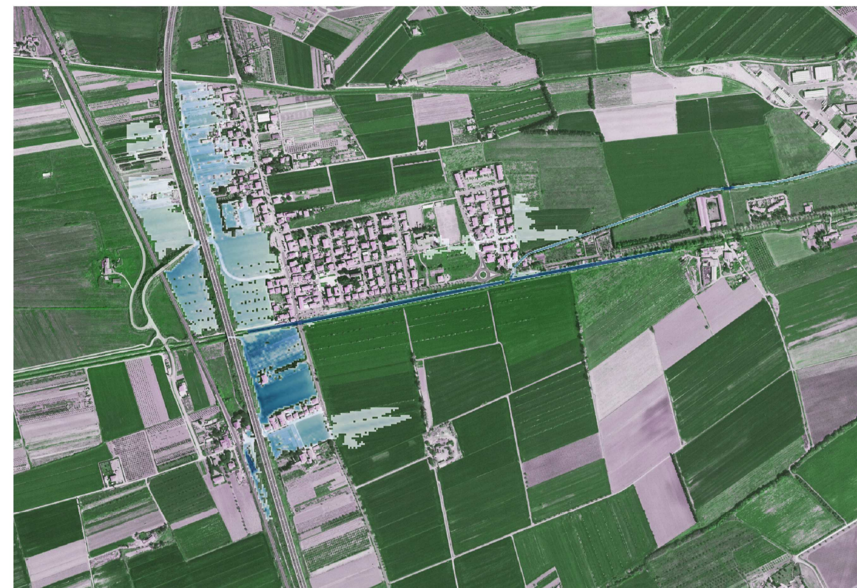
ESONDAZIONI TR30- AREA GOLF