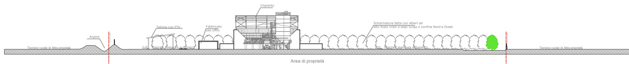
Sezione ambientale B-B'

L'intera area è perimetrata da un muretto con recinzione a rete metallica fatta eccezione per il lato a sud dove sarà presente solamente la rete metallica.